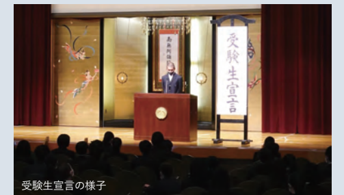
受験生宣言の様子